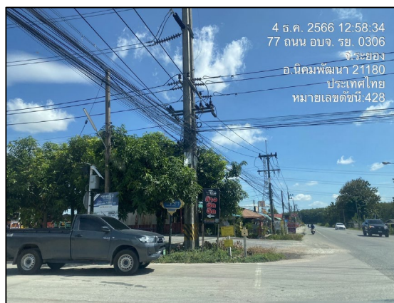
แนวท่อส่งก๊าซฯ บริเวณถนนท้องถนนบ้านมาบข่า- สำนักอ้ายฮองตัดกับทางหลวงแผ่นดินหมายเลข 3191