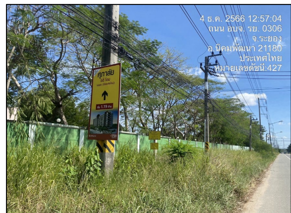
แนวท่อก๊าซธรรมชาติ บริเวณริมรั้วของโรงไฟฟ้า เอ็กโก โคเจน เนอเธชั่น

ภาพที่ 3.2-3 ภาพถ่ายระบบรักษาความปลอดภัยบริเวณสถานีก๊าซและโครงการท่อส่งก๊าซธรรมชาติ ที่แอลพี โคเจน จังหวัดระยองของบริษัท ทีแอลพี โคเจนเนอเรชั่น จำกัด (ปัจจุบันเปลี่ยน ชื่อเป็น บริษัท เอ็กโก โคเจนเนอเรชั่น จำกัด)