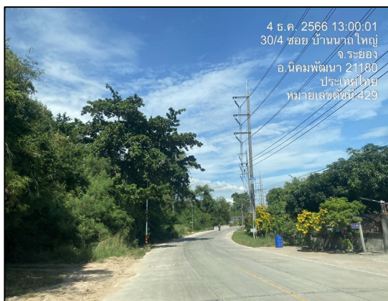
แนวท่อก๊าซฯ ริมถนนท้องถนนบ้านมาบข่า-สำนักอ้ายฮอง มุ่งไปยังทางหลวงแผ่นดินหมายเลข 3191