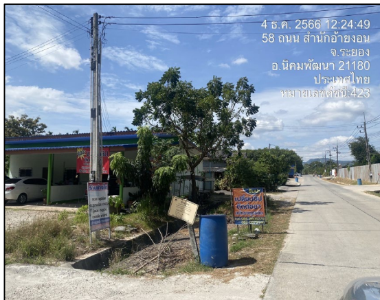
ป้ายเตือนแนวท่อส่งก๊าซธรรมชาติ