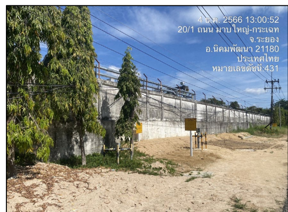
แนวท่อส่งก๊าซฯ ริมถนนท้องถนนบ้านมาบข่า